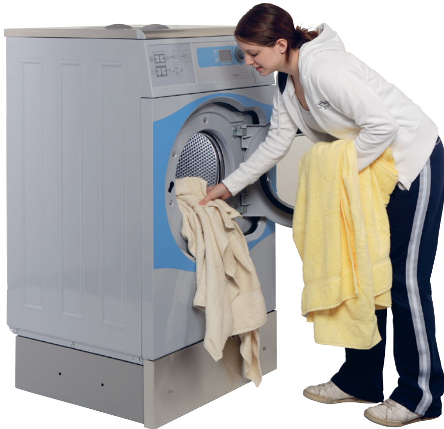
W465H voetstuk met gesloten voorkant en zijpanelen